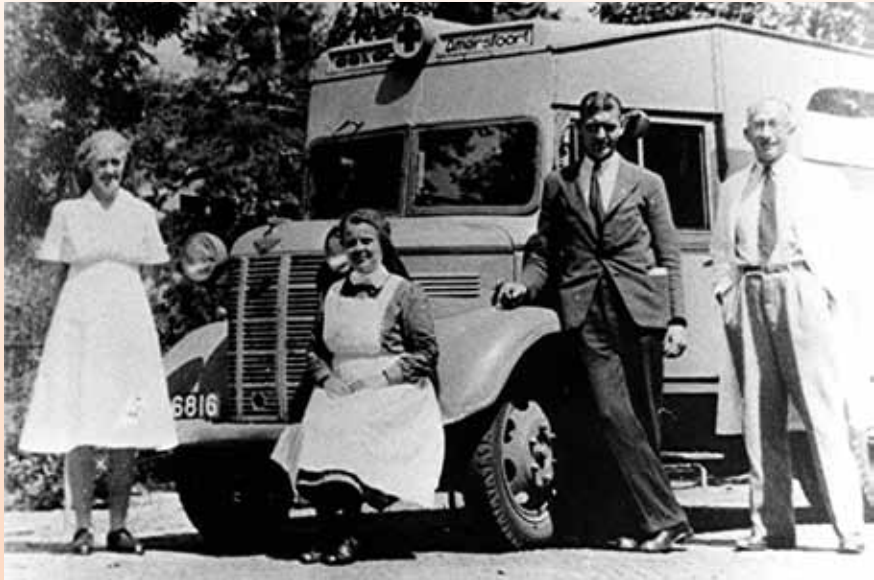
Een overeenkomstige Austin K2 'bellewagen' uit 1942 van de G.G. & G.D. Amersfoort, zoals die in 1947 als ziekenauto bij de brandweer van Rijswijk in reserve werd gehouden.