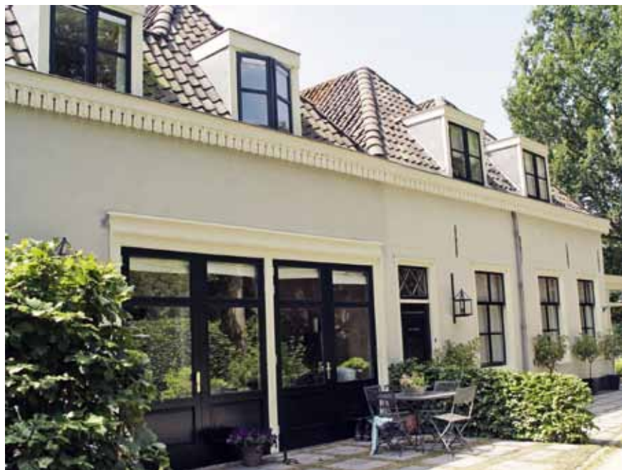
In deze voormalige paardenstal in het Julialaantje - het zogenaamde 'Zwarte Laantje' vanwege het kolengruis, dat als wegbedekking werd gebruikt - naast Villa Beukenheim werd de Renault-ziekenauto van Vondeling gestald

'Grote' Piet W. van der Peet. Grote Piet ging wel boven de garage aan de Kerklaan wonen. In een gezamenlijke advertentie in de 'Origineele Rijswijksche Courant' van vrijdag 2 april 1948 werd de overdracht bekend gemaakt. In die advertentie zei Grote Piet, dat 'ook de ziekdienst, transport in binnen- en buitenland, aan het bedrijf blijft verbonden' . 18 Enkele maanden later werd de Studebaker echter toch verkocht.