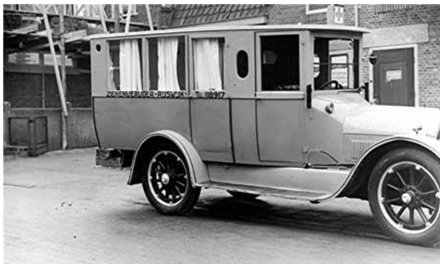
De tweekleurige Cadillac-ziekenwagen met kenteken H-11884 op de Kerklaan tegenover nummer 24 in Rijswijk